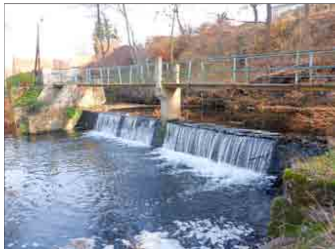
Ansicht auf das Wehr Sportplatz von unterstrom

Im Gebiet des Ortsteiles Gräfinau-Angstedt, Gemeinde Wolfsberg, befindet sich unterhalb des Sportplatzes im Gewässer der Ilm das Wehr Sportplatz. Das Wehr einschließlich der zugehörigen Anlagenteile befindet sich in einem desolaten Zustand. Der ehemals abgehende Mühlgaben ist im Anschlussbereich an die Wehranlage verfüllt.